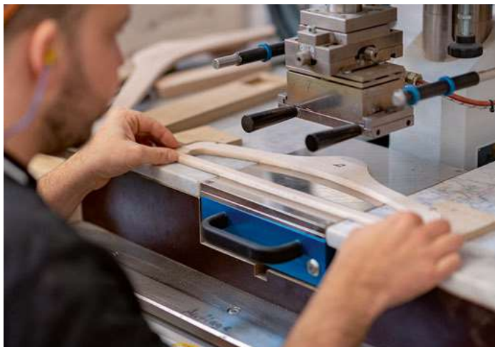
Die Kleiderbügel werden aus heimischem Holz gefertigt. The hangers are made of local wood.

SWISS is committed to society and business in a variety of ways with a focus on Switzerland and is a member of a number of national and international organisations. SWISS’s philanthropic commitments focus on supporting children and adolescents, with numerous charitable commitments and partnerships including with SOS Children’s Villages, the Kinderhilfe Sternschnuppe Foundation, and Pro Juventute. In the procurement process, SWISS considers special suppliers such as the Places to Live Foundation and the Pigna Foundation, a workshop for people with disabilities in their home town of Kloten.